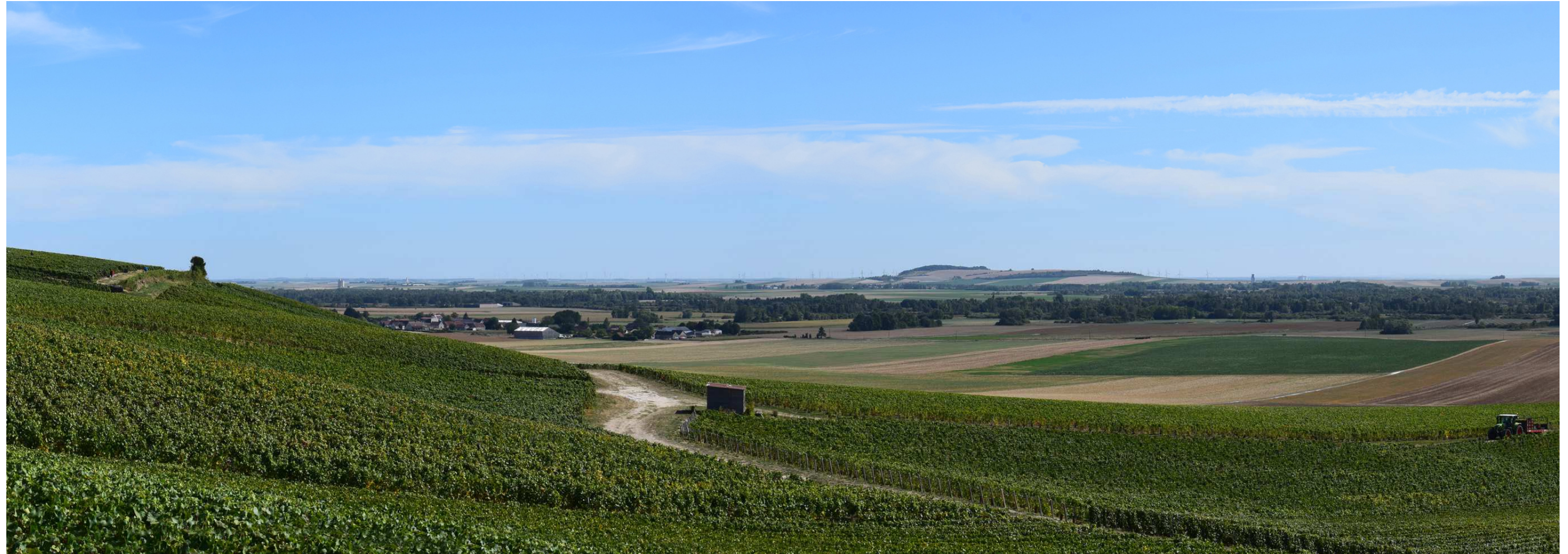
Le site actuel