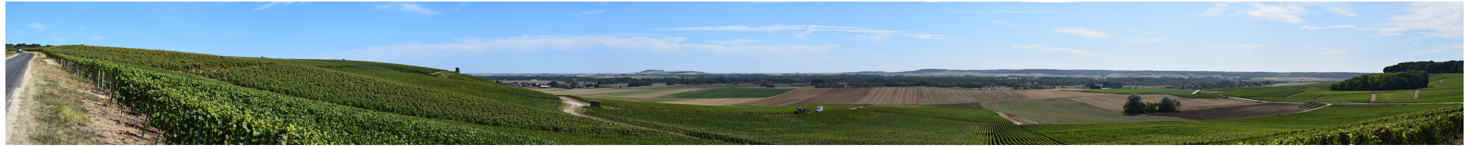
Le site actuel